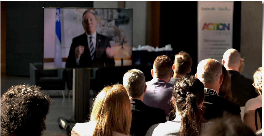
Le discours du premier ministre, François Legault, avec les invités de dos.