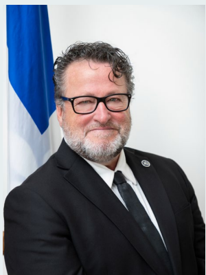
Le ministre de l'Agriculture, des Pêcheries et de l'Alimentation,

Je termine en rappelant que les travaux sont en cours avec le gouvernement fédéral pour le renouvellement du Fonds des pêches du Québec. Mon objectif est de parvenir à une entrée en vigueur du programme le plus rapidement possible, en faveur de l'industrie des pêches et de l'aquaculture.