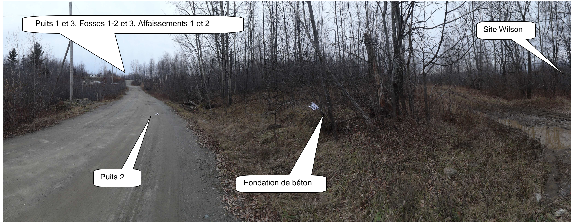
AH-2014-11-26-001 – Vue du Puits 2 sécurisé avec une dalle de béton et à droite la fondation de béton (vue du Nord-Ouest vers le Sud-Est)