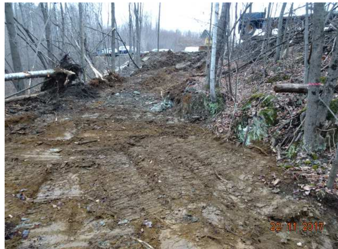
AH-2017-11-22-002 - Fosse 1 après la sécurisation par remblayage en novembre 2017 par le MERN (vue vers le Nord)