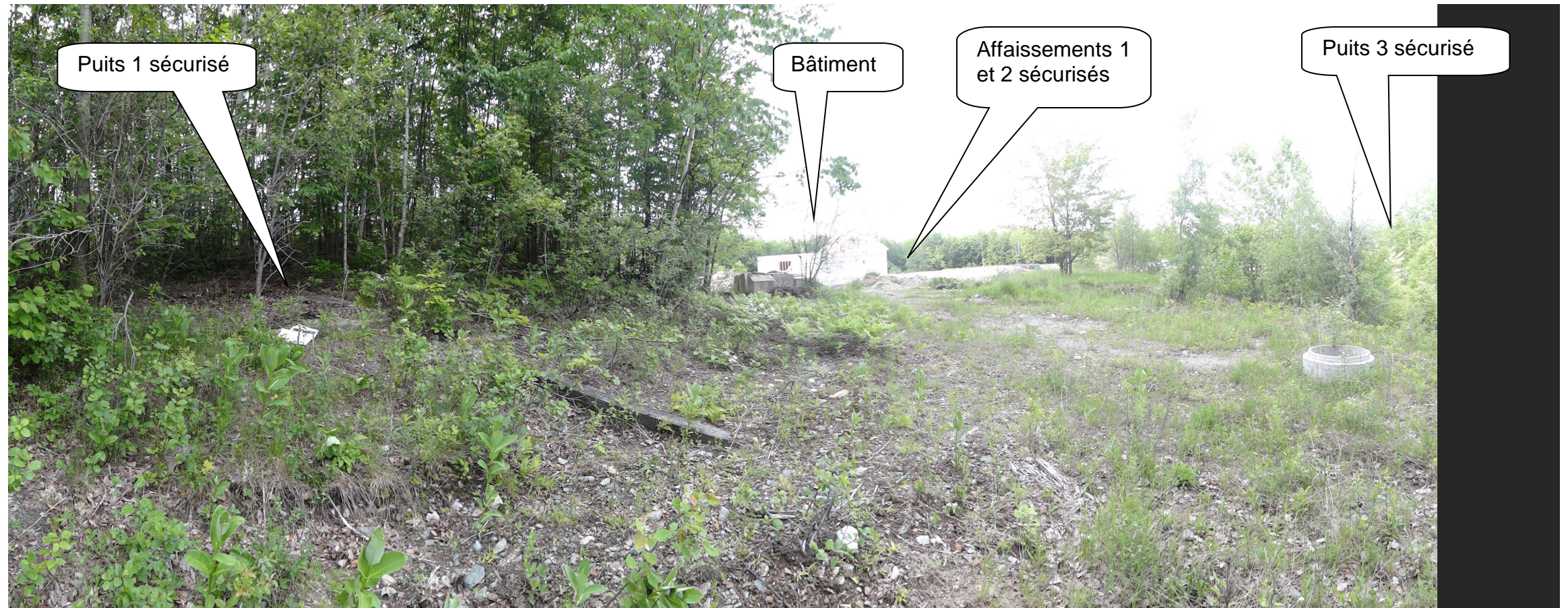
AH-2013-06-10-005 – Puits 1 à gauche de la photo et en arrière plan, vue des 2 affaissements et du Puits 3 (vue de l'Ouest vers Nord-Est)