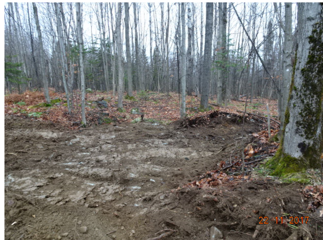
AH-2017-11-22-004 - Fosse 2 après la sécurisation par remblayage en novembre 2017 par le MERN (vue vers le Nord)