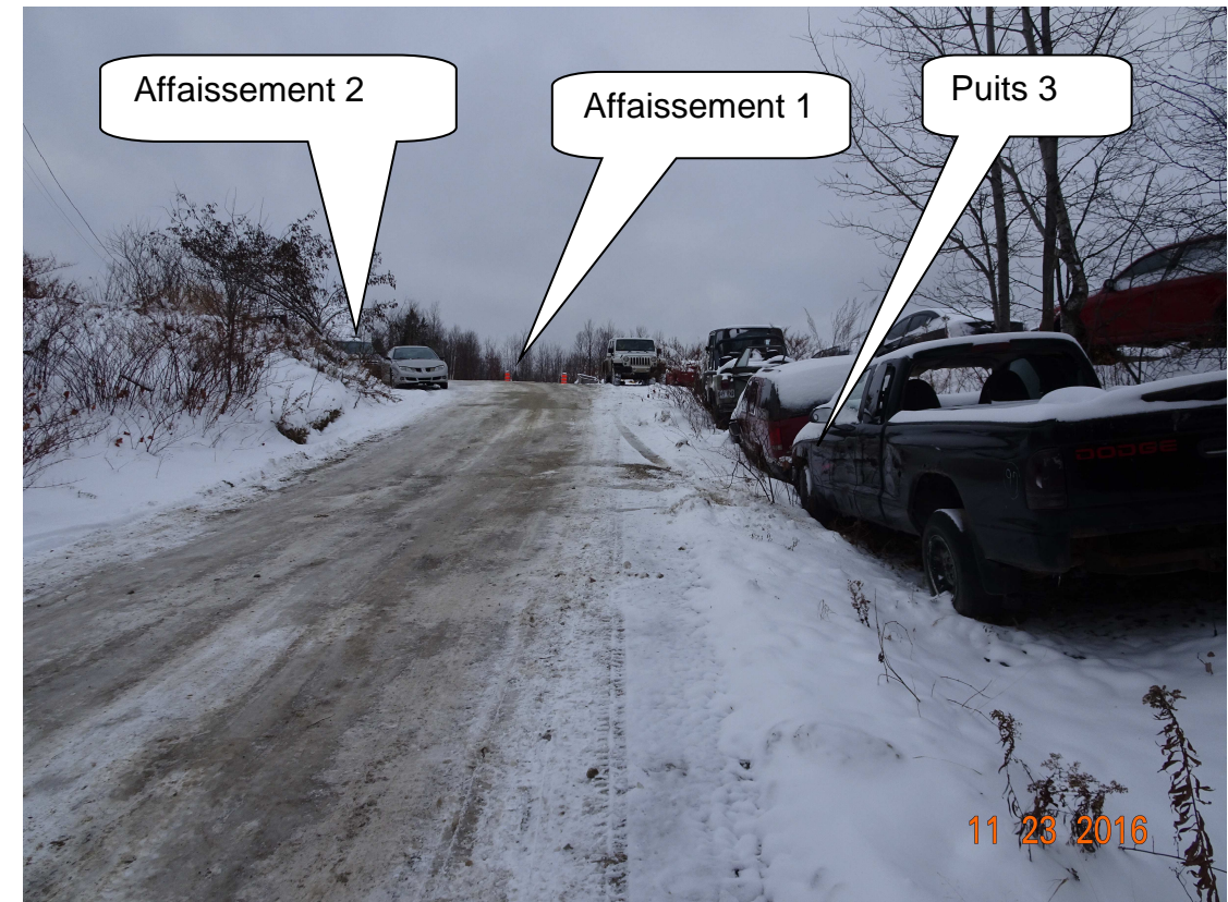
AH-2016-11-23-001 – Puits 3, affaissement 1 et 2 sécurisés avec une dalle de béton et conformement (vue vers le Nord-Est)