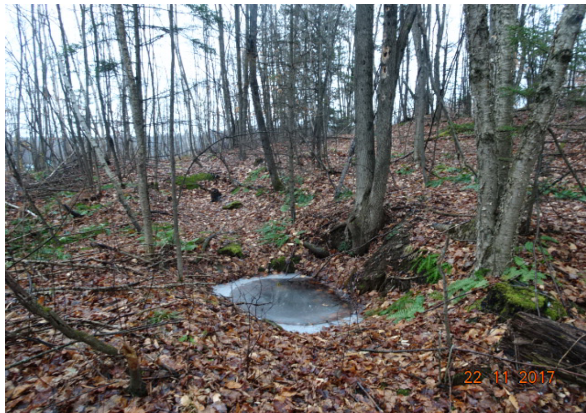
AH-2017-11-22-005 - Fosse 3 avant la sécurisation par remblayage en novembre 2017 par le MERN (vue vers le Sud-Ouest)