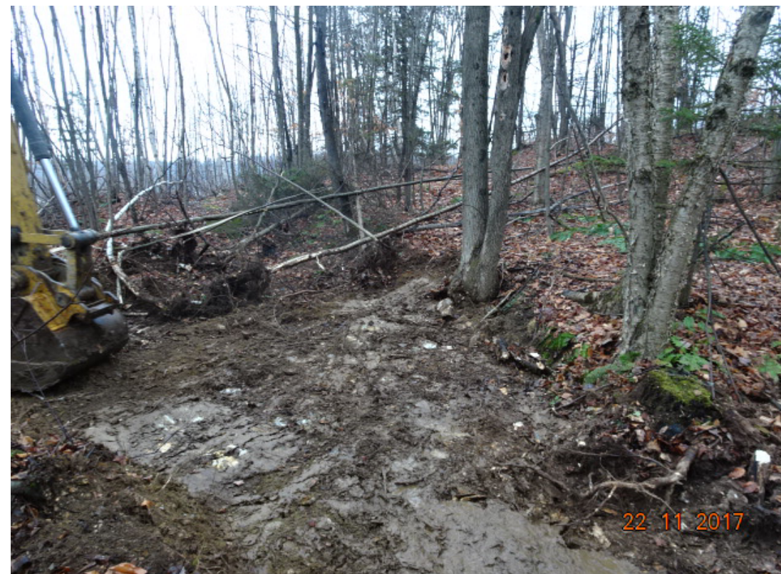
AH-2017-11-22-006 - Fosse 3 après la sécurisation par remblayage en novembre 2017 par le MERN (vue vers le Sud-Ouest)