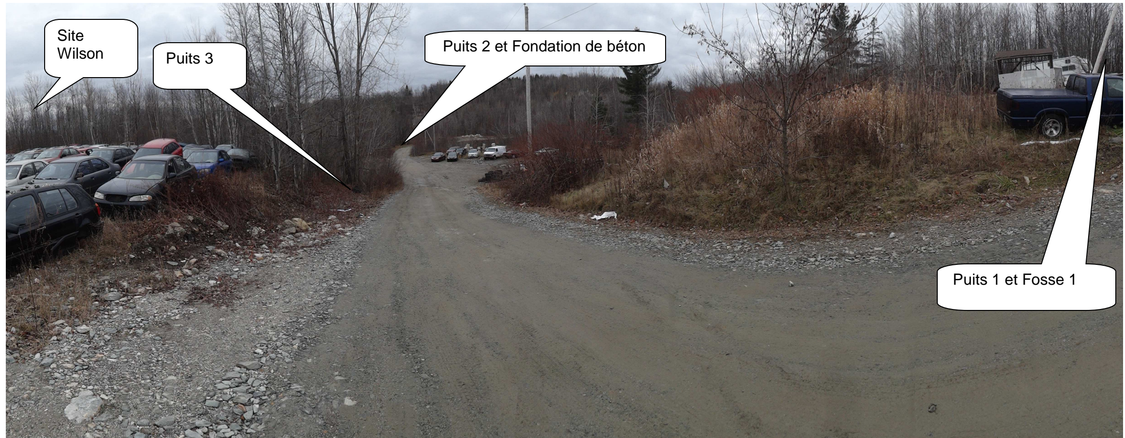
AH-2014-11-26-005 – Vue du Puits 2 et 3 sécurisés avec une dalle de béton et conforment (vue du Sud-Est vers le Nord-Ouest)