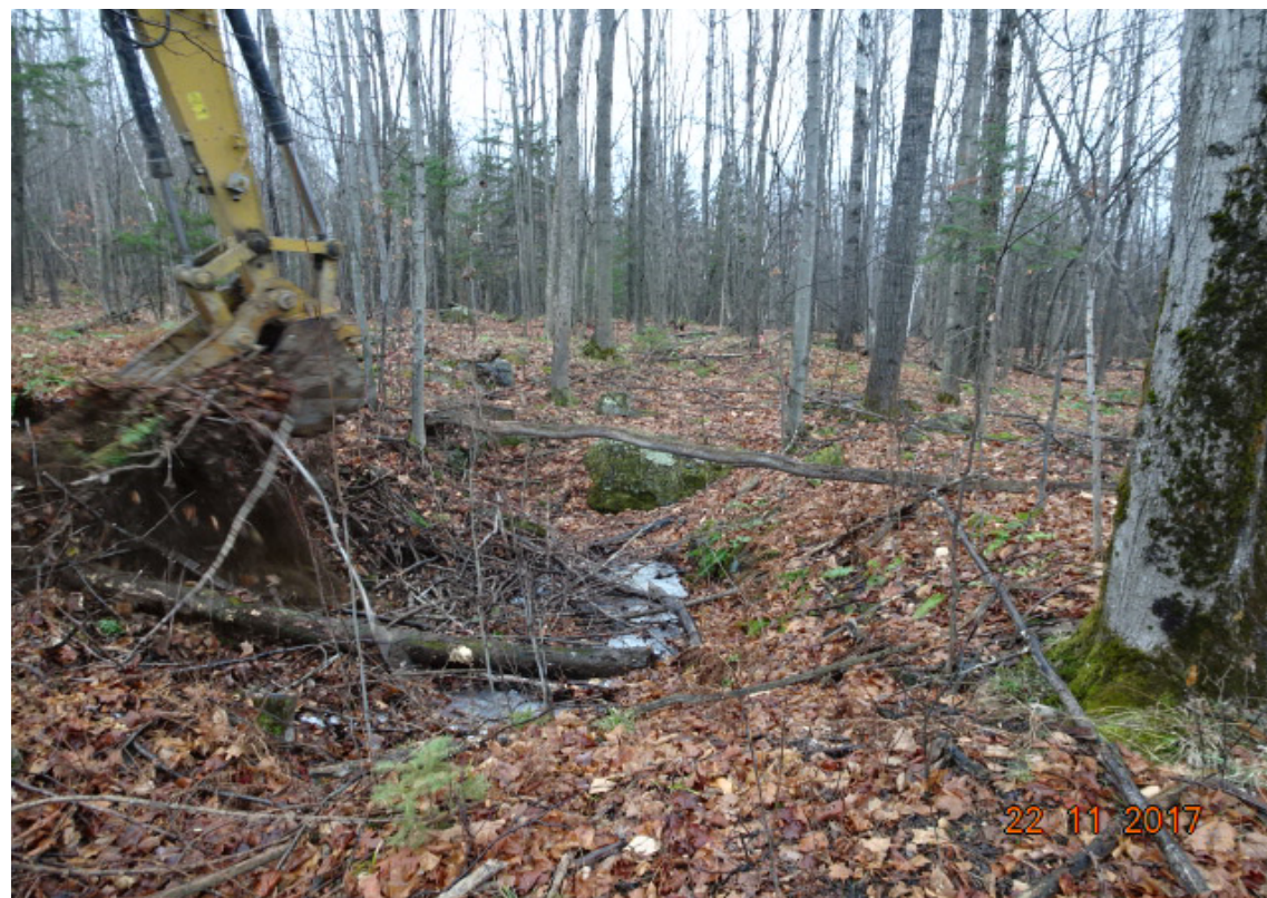
AH-2017-11-22-003 - Fosse 2 avant la sécurisation par remblayage en novembre 2017 par le MERN (vue vers le Nord)