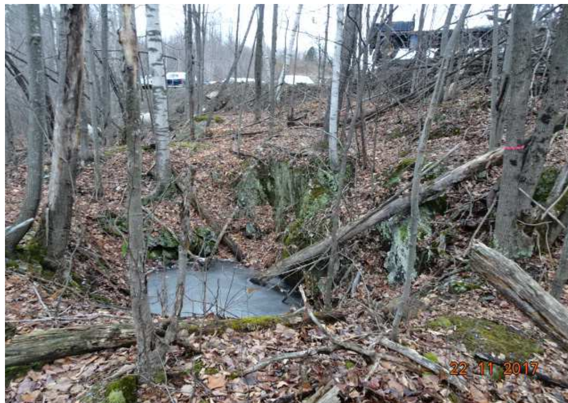
AH-2017-11-22-001 - Fosse 1 avant la sécurisation par remblayage en novembre 2017 par le MERN (vue vers le Nord)