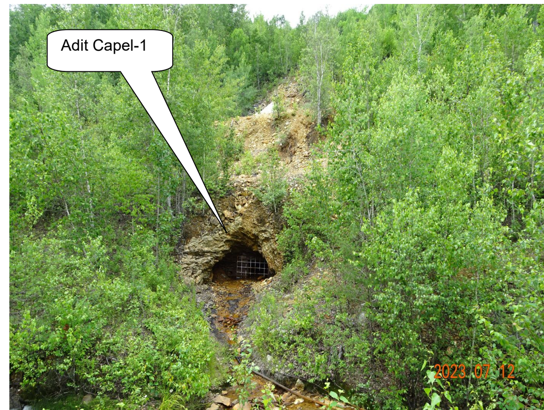
Cap-2023-07-12-004 – Adit Capel-1 et le puits Capel-1 conforme (vue vers le Nord) Coordonnées UTM Nad 83 : 272204 Est, 5022843 Nord