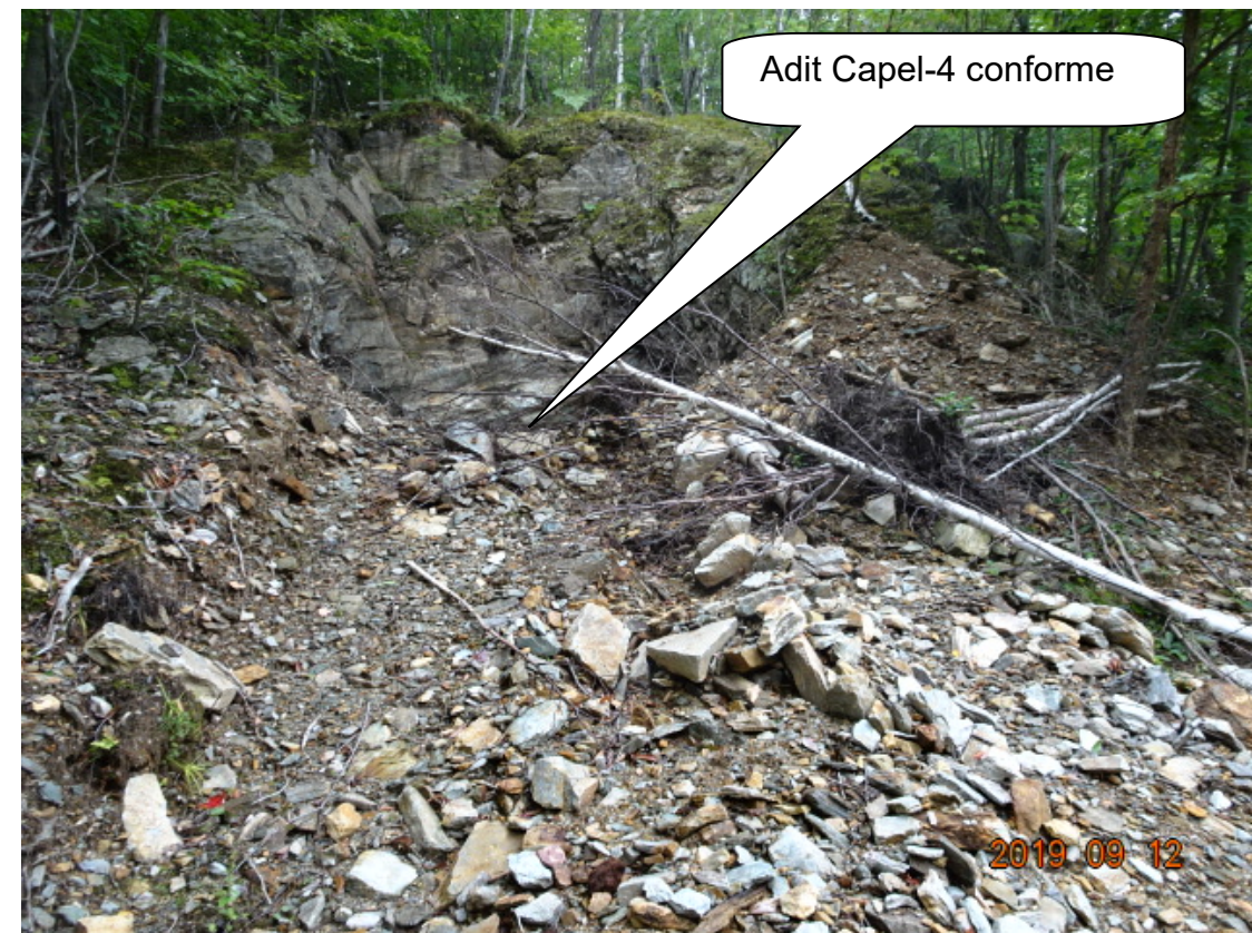
Cap-2019-09-12-006 – Adit Capel-4 conforme et sécurisé par remblayage (vue vers le Sud-Est) Coordonnées UTM Nad 83 : 272255 Est, 5023104 Nord