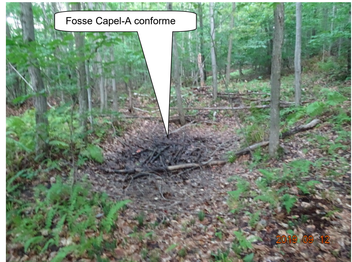
Cap-2019-09-12-004 – Fosse Capel-A conforme, elle restera telle quelle (vue vers le Nord-Ouest) Coordonnées UTM Nad 83 : 272213 Est, 5022978 Nord