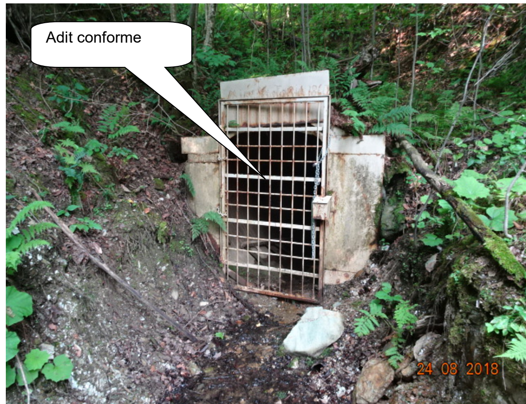
Cap-2018-08-24-001 – Adit Victoria sécurisé avec une grille et barrée avec un cadenas (vue vers l'Est) Coordonnées UTM Nad 83 : 272740 Est, 5023379 Nord