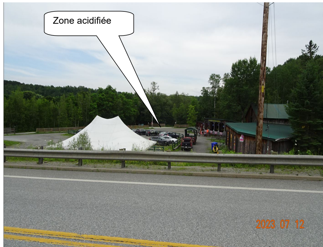
Cap-2023-07-12-003 – Zone acidifiée située du côté Sud de la route 108 (vue vers le Sud) Coordonnées UTM Nad 83 : 272980 Est, 5022493 Nord