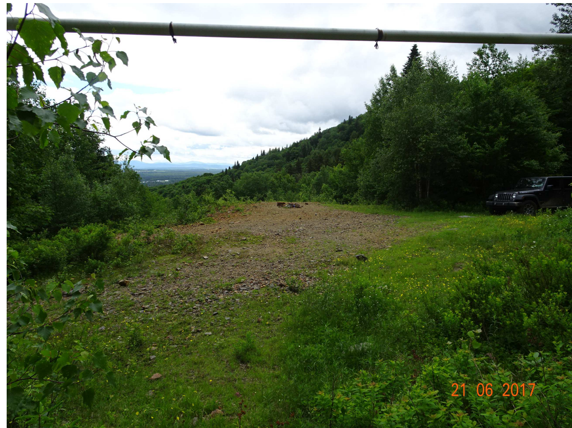
Cop-2017-06-21-002 - À partir de l'Adit ou du côté Nord, vue de la Halde Oxydée (vue vers le Sud)