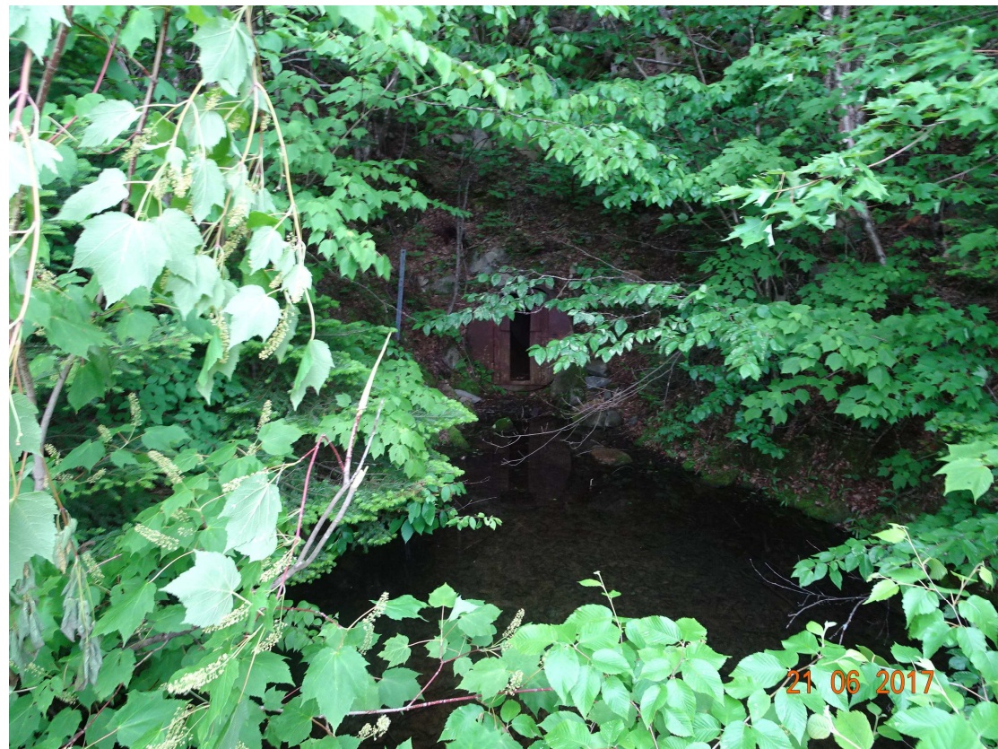
Cop-2017-06-21-001 - Vue de l'Adit sécurisé avec un tuyau qui n'a pas de grille, donc, non conforme (vue vers le Nord)