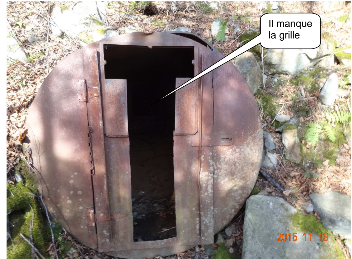
Cop-2015-11-18-002 - Vue de l'Adit sécurisé avec un tuyau qui n'a pas de grille, donc, non conforme (vue vers le Nord)