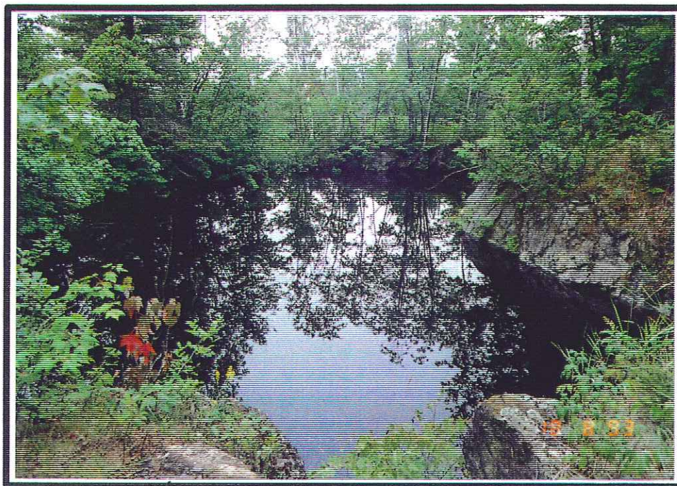
Fosse no. 4