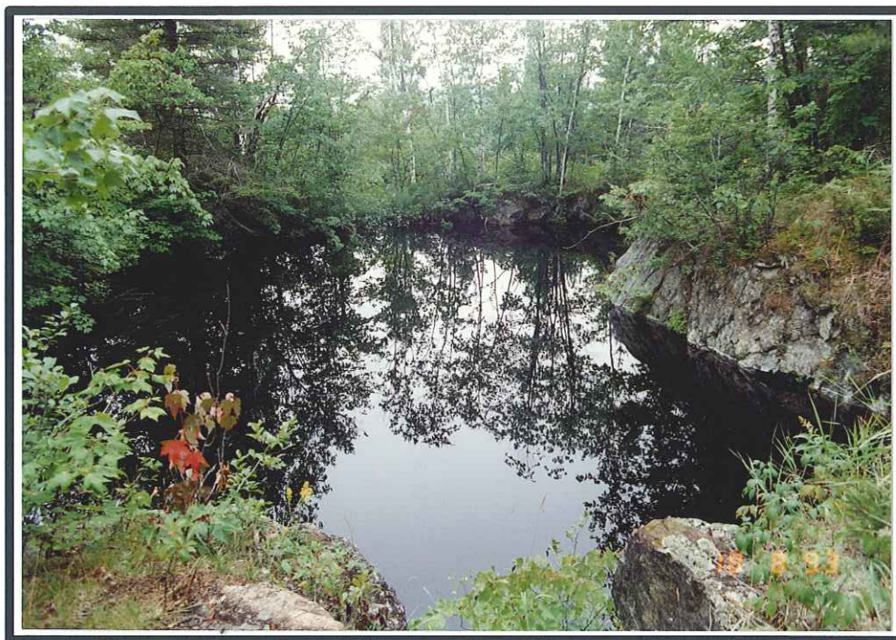
Fosse no. 4