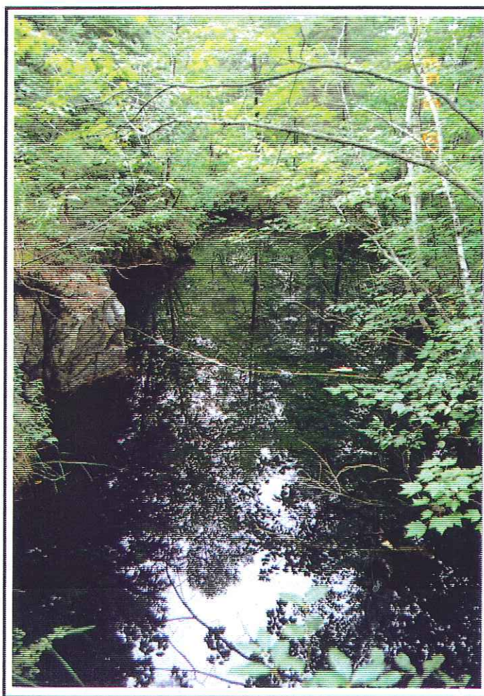
Fosse no. 1