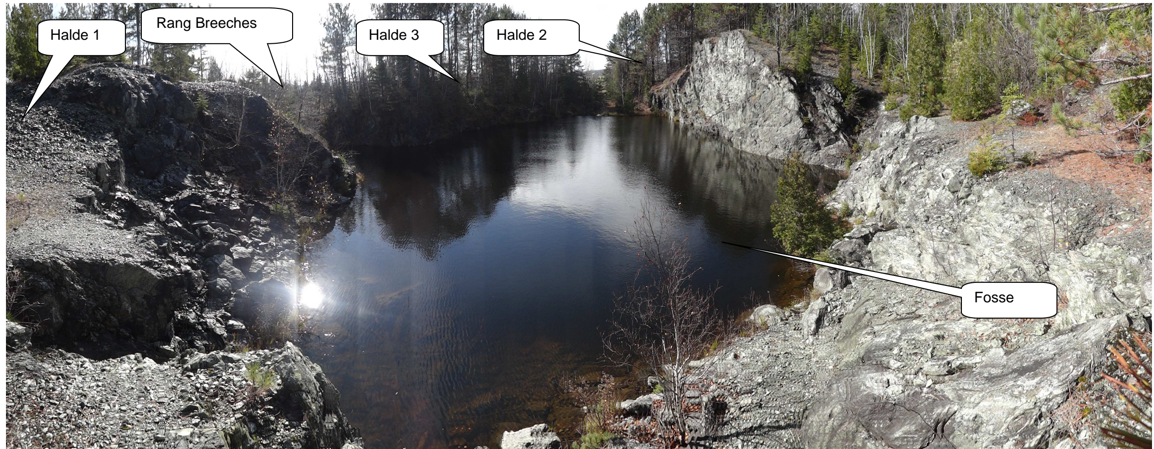
BE-2014-10-22-003 – Vue de la Fosse à sécuriser avec une clôture métallique (vue du Sud vers le Nord)