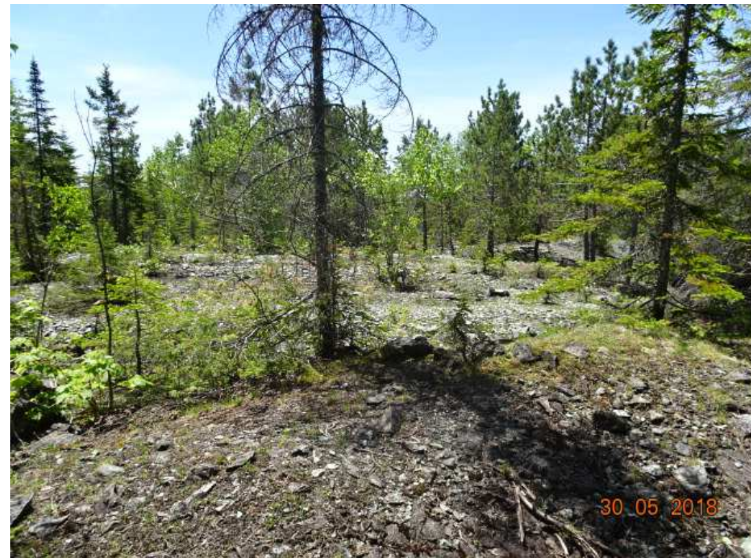
BE-2018-05-30-002 – À partir du côté Nord-Est, Vue de la Halde à stériles 1 (vue vers le Sud-Ouest)