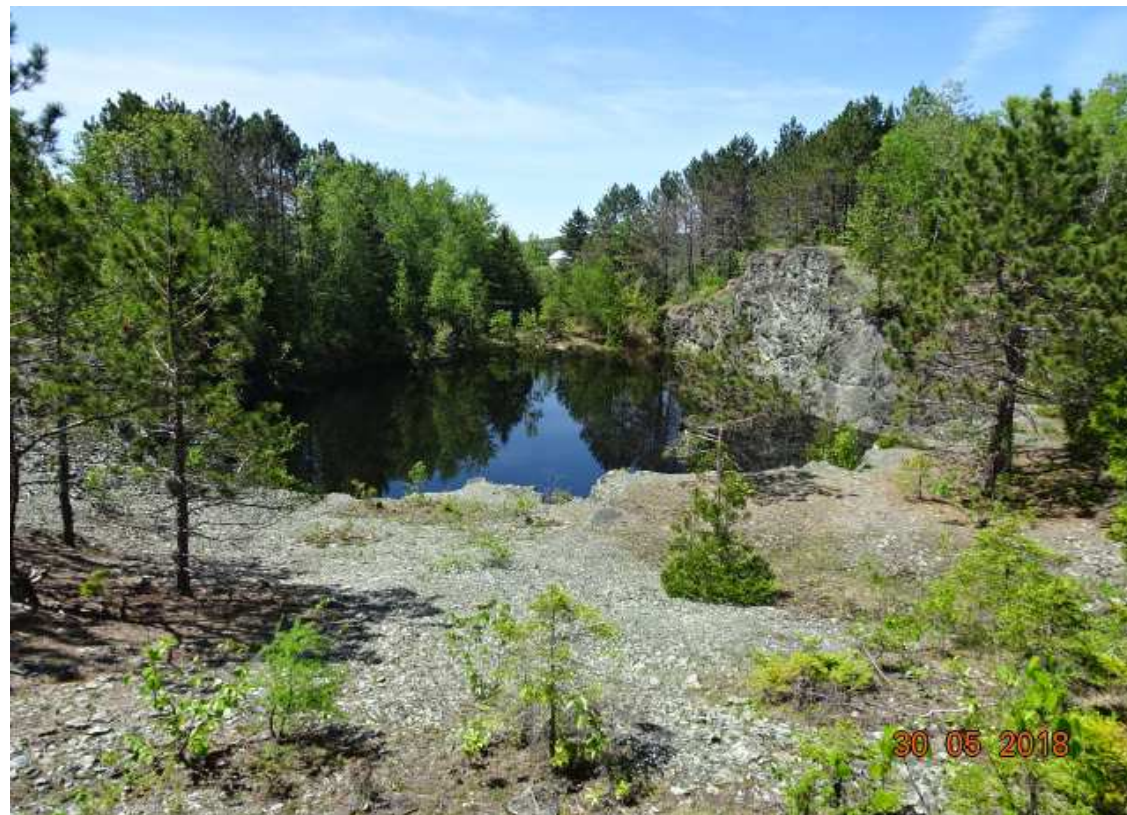
BE-2018-05-30-001 – À partir du côté Est, vue de la Fosse à sécuriser avec une clôture métallique (vue vers l'Ouest)