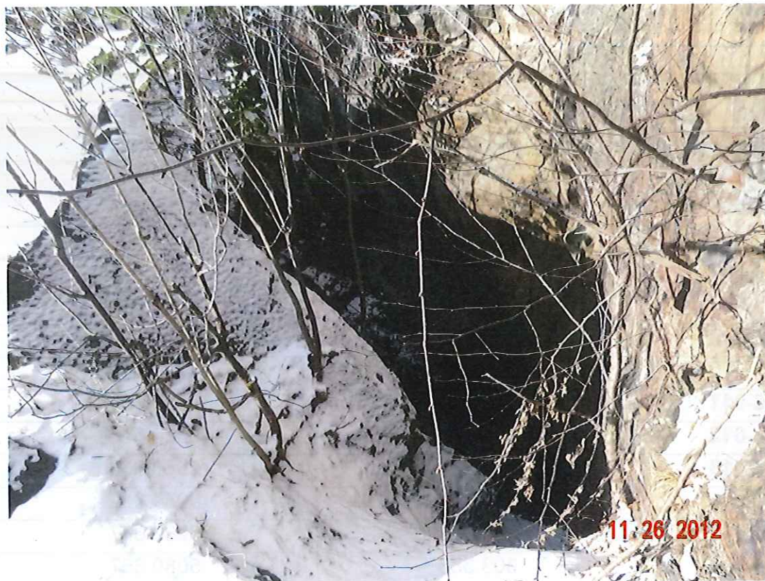
QAn-2012-11-26-002 – Puits 1 à l'intérieur de la zone clôturée non conforme (vue vers le Nord-Ouest)