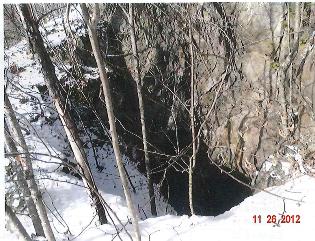
QAn-2012-11-26-003 – Puits 2 à l'intérieur de la zone clôturée non conforme (vue vers le Nord-Ouest)