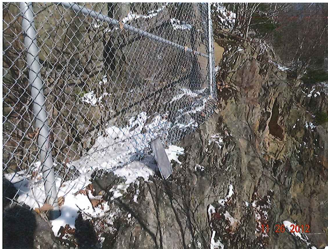
QAn-2012-11-26-016 – Espace # 12 du côté Sud de la clôture (vue vers le Nord-Est)