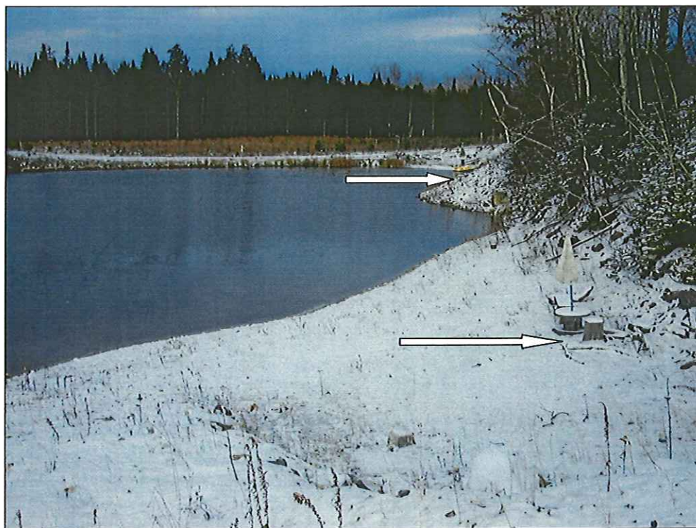
Les abords de la fosse non clôturée font l'objet d'un endroit de villégiature, les flèches indique la présence d'un pédalo et d'une table de piquer avec parasol