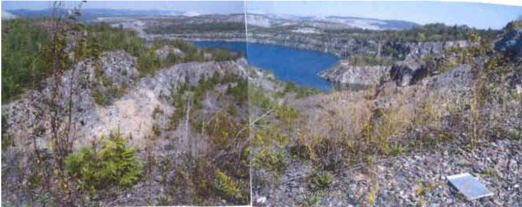
VRi-2010-08-30-021 et 022 – La fosse à parois verticales du côté Sud et à gauche la halde à stériles du côté Sud (vue vers le nord).