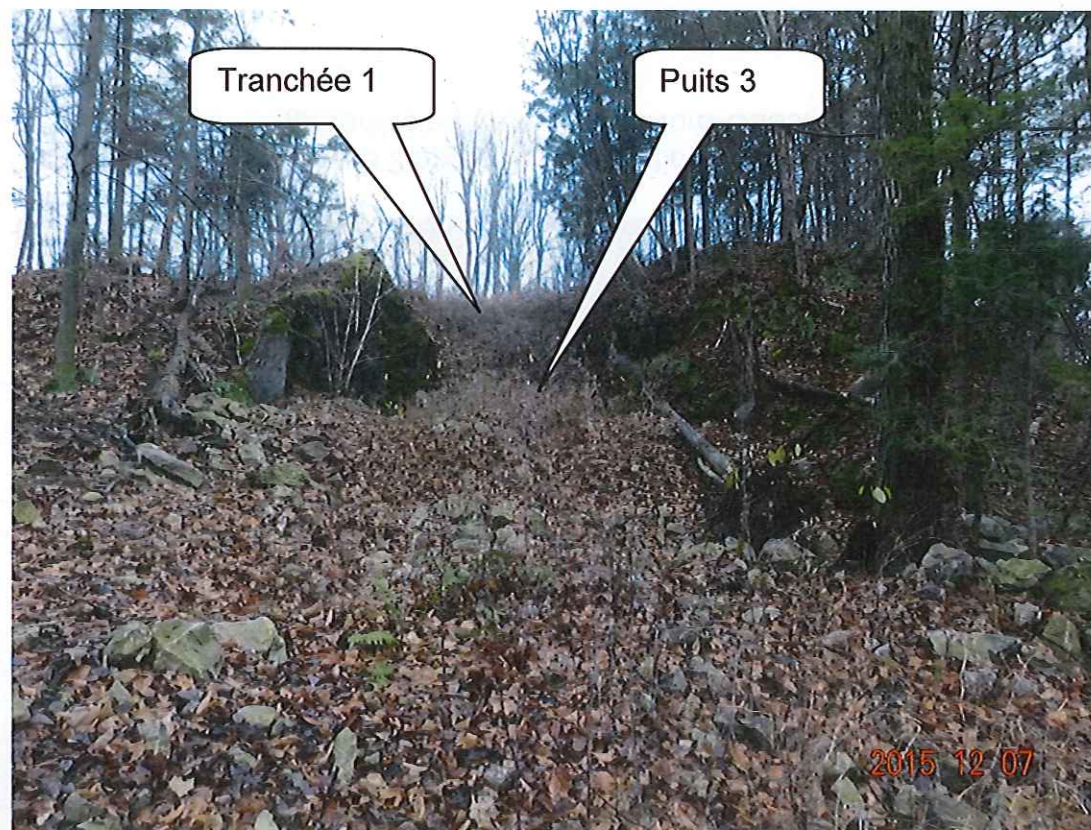
Yal-2015-12-07-001 – Puits 3 et Tranchée 1 sécurisés par remblayage en 2012 par le MERN et qui sont conformes (vue vers le Sud-Ouest)