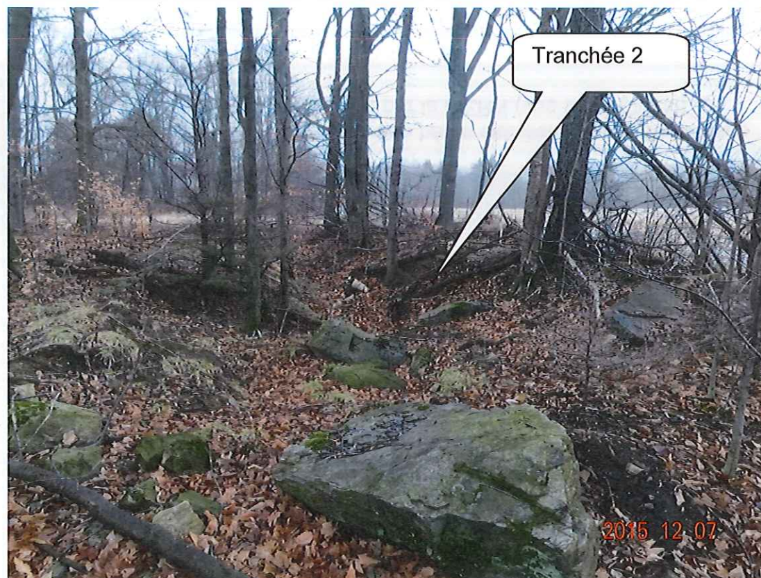
Yal-2015-12-07-003 – Tranchée 2 sécurisée par le propriétaire en 2000 (vue vers le Sud-Est)