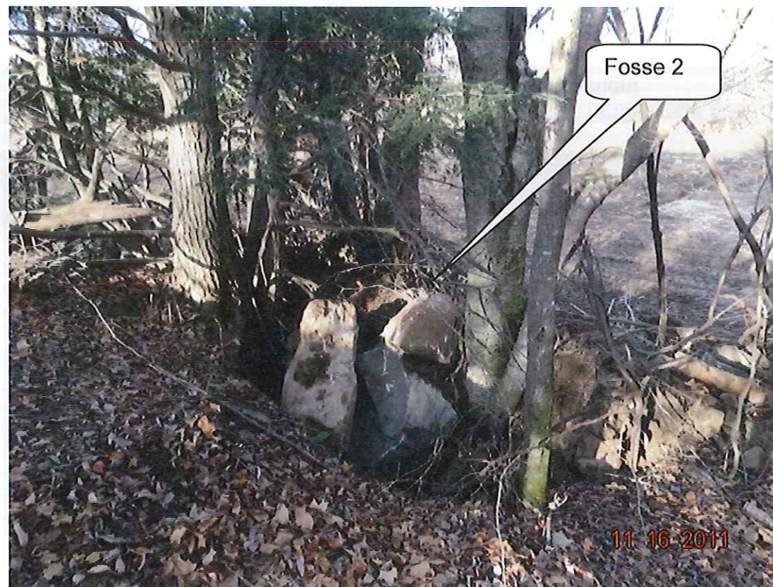
Yal-2011-11-014 – Fosse 2 après la sécurisation par remblayage (propriétaire) (vue vers le Nord-Ouest)