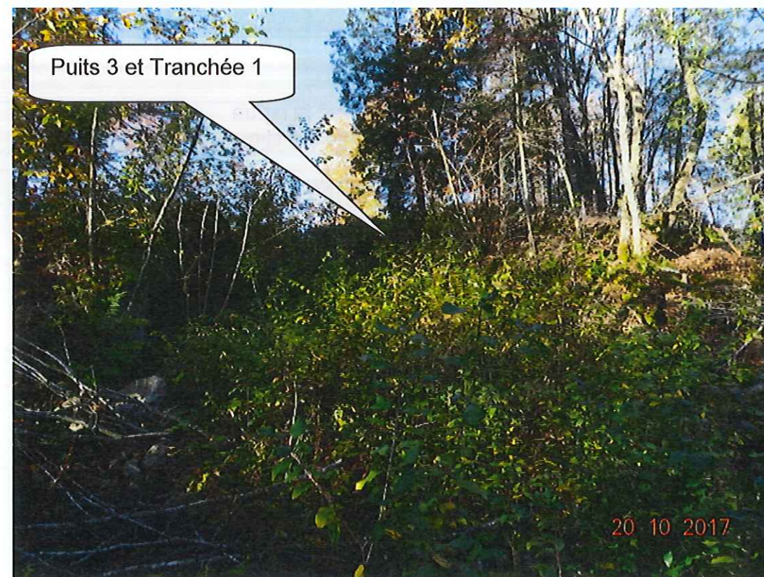
Yal-2017-10-20-001 – Puits 3 et Tranchée 1 sécurisés par remblayage en 2012 par le MERN et qui sont conformes (vue vers le Sud-Ouest)