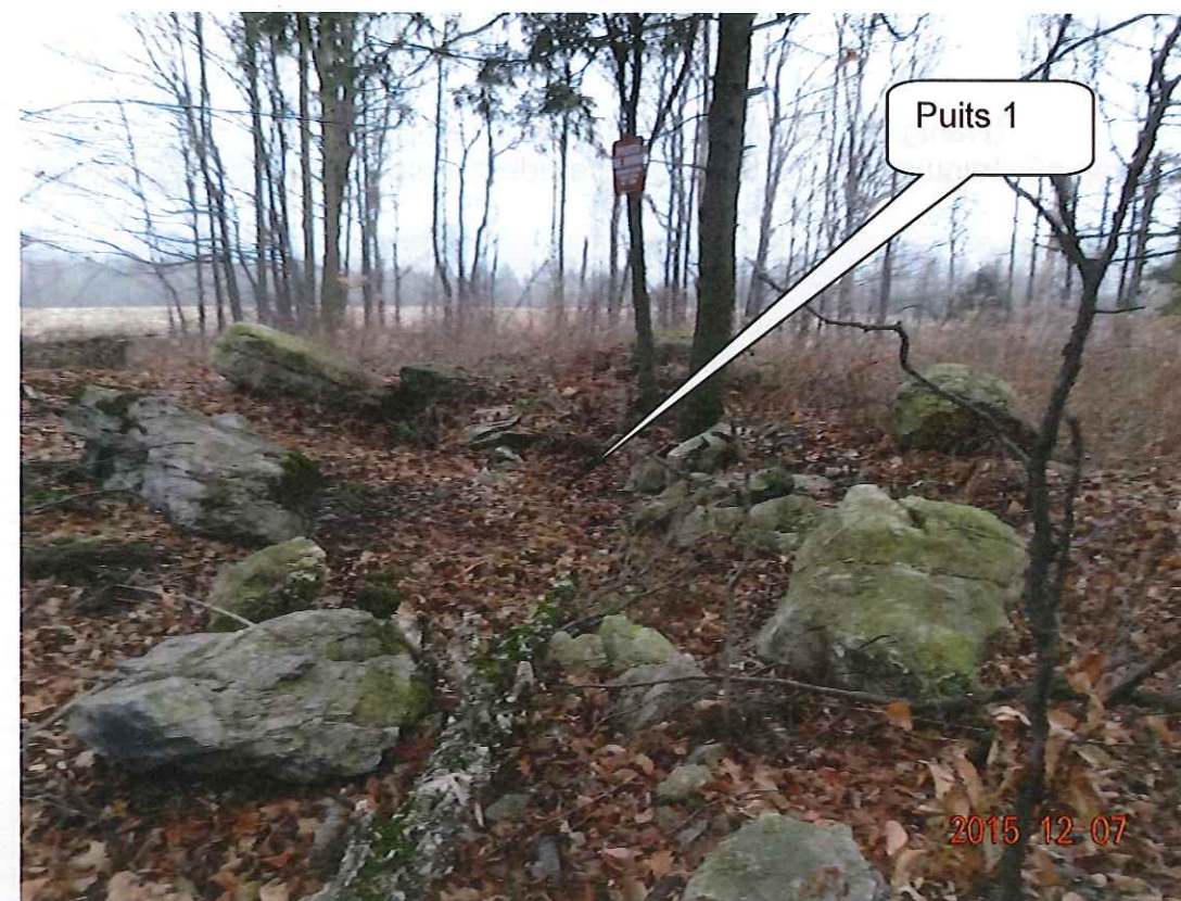
Yal-2015-12-07-002 – Puits 1, 2 dalles de béton stabilisées avec de grosses roches en 2012 par le MERN (vue vers l'Ouest)