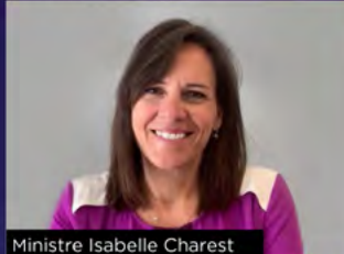
Ministre Isabelle Charest