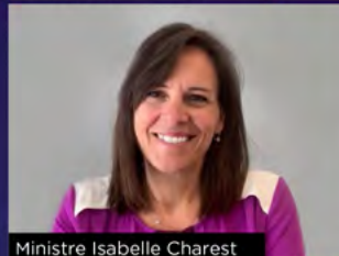
Ministre Isabelle Charest