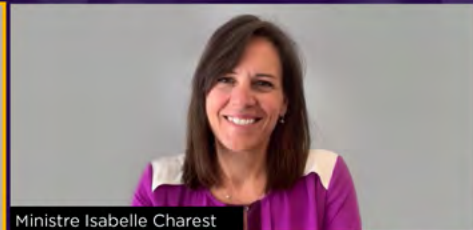
Ministre Isabelle Charest