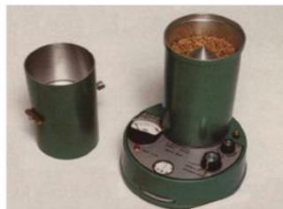
Humidimètre de modèle 393

Marques de commerce : Conuclear, Labtronics, Motomco, Nuclear