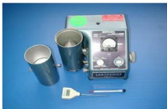
Humidimètre de modèle 919

Marques de commerce : Conuclear, Labtronics, Motomco, Nuclear