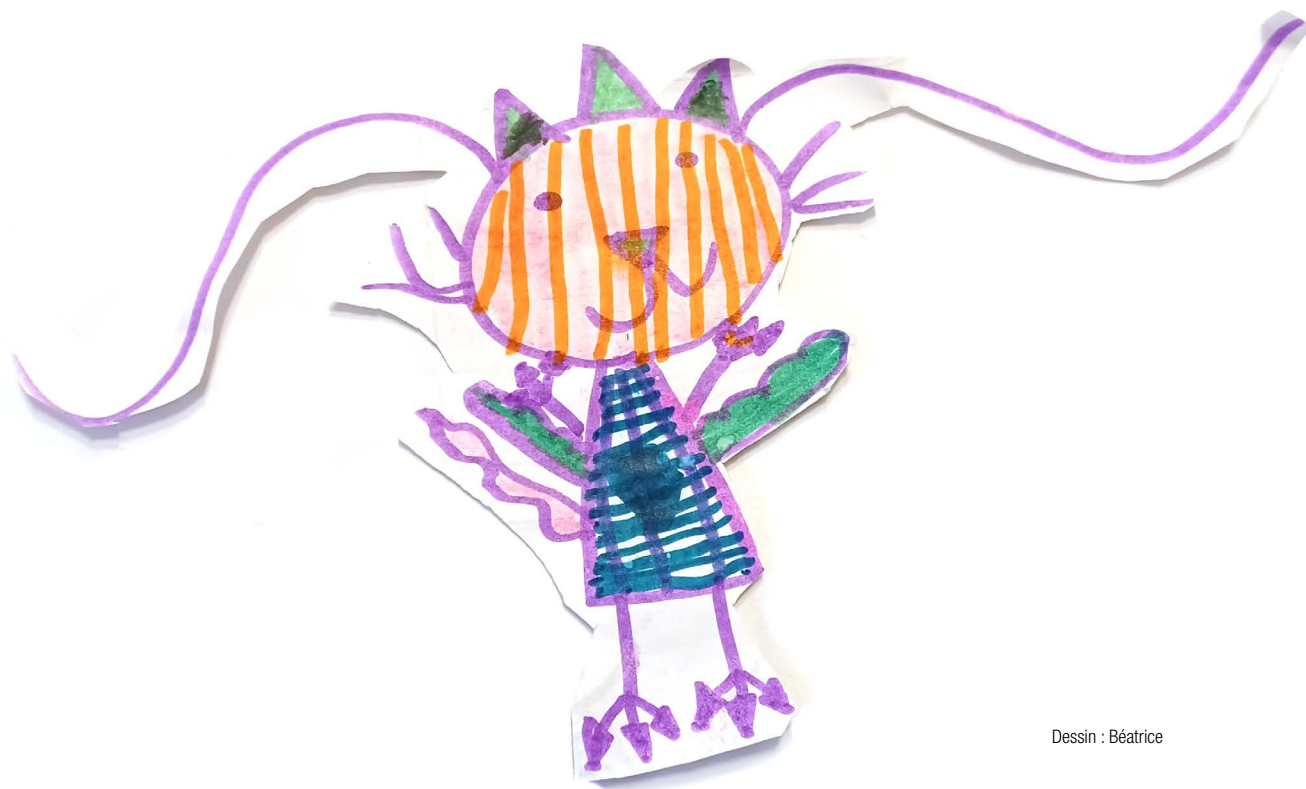
Dessin : Béatrice

Le programme d'activités est actualisé périodiquement, notamment afin de tenir compte de l'évolution des besoins des élèves et du projet éducatif de l'école ainsi que du personnel y travaillant. Il s'agit d'une occasion pour l'équipe du service de garde de réfléchir à ses acquis, de s'interroger sur ses pratiques et d'examiner les ajustements qui peuvent être apportés au programme d'activités.