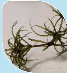
Petite naïade Najas minor