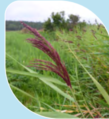
Roseau commun 2 Phragmites australis ssp. australis