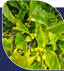
Célastré asiatique Celastrus orbiculatus