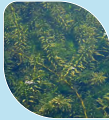
Élodée dense* Egeria densa