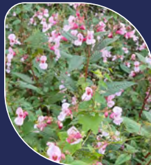
Impatiante glanduleuse Impatiens glandulifera