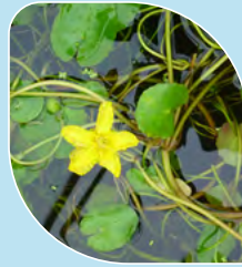
Faux-nymphéa pelté Nymphoides peltata