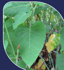
Renouée de Sakhaline Reynoutria sachalinensis