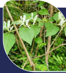
Chèvrefeuille de Maack Lonicera maackii