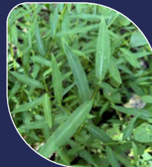
Microstégie en osier Microstegium vimineum