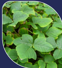
Kudzu Pueraria montana