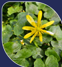
Renoncule ficaire Ficaria verna