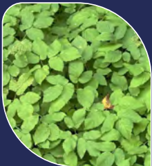
Égopode podagraire* Aegopodium podagraria