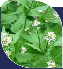
Alliaire officinale Alliaria petiolata