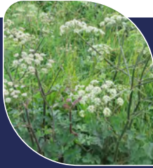
Berce commune (spondyle) Heracleum sphondylium