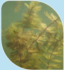
Myriophylle à épis Myriophyllum spicatum