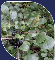
Nerprun cathartique Rhamnus cathartica