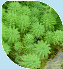
Myriophylle aquatique* Myriophyllum aquaticum