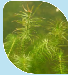
Hydrille verticillée Hydrilla verticillata