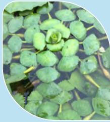
Châtaigne d'eau Trapa natans