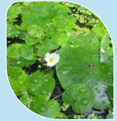
Hydrocharide grenouillette Hydrocharis morsus-ranae