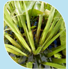
Stratiote faux-aloès Stratiotes aloides