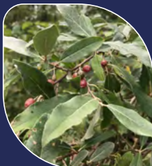
Oléastre à ombelles Elaeagnus umbellata