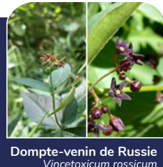
Dompte-venin de Russie Vincetoxicum rossicum Dompte-venin noir Vincetoxicum nigrum