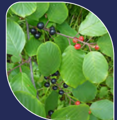
Nerprun bourdaine* Frangula alnus