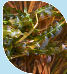
Potamot crépu Potamogeton crispus