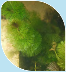
Cabomba de Caroline* Cabomba caroliniana