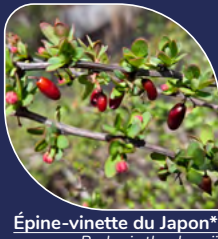
Épine-vinette du Japon* Berberis thunbergii Seuls les cultivars Emerald Carousel et Jade Carousel sont interdits.