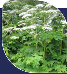
Berce du Caucase Heracleum mantegazzianum