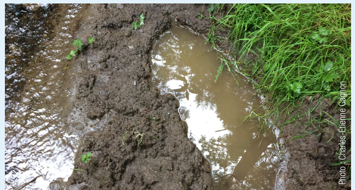
Souille utilisée par les sangliers pour se rafraîchir et se protéger des insectes.