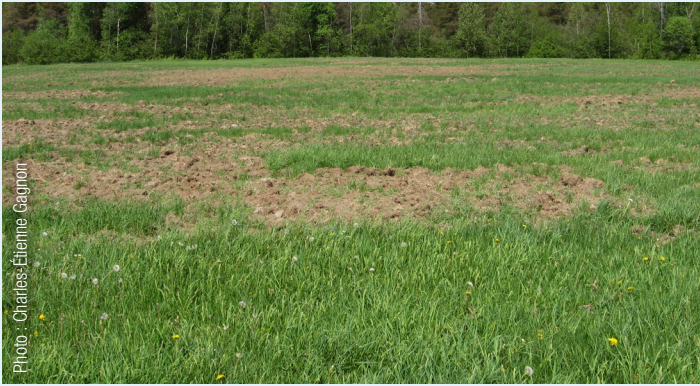
Domages causés par les sangliers dans un champ agricole.