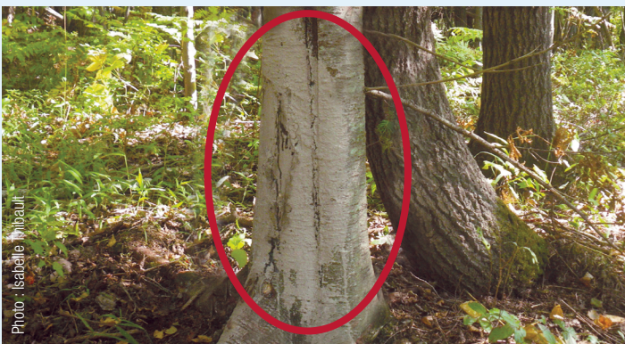
Tache de boue séchée sur un tronc d'arbre laissée par les sangliers qui s'y frottent pour soulager leurs démangeaisons.