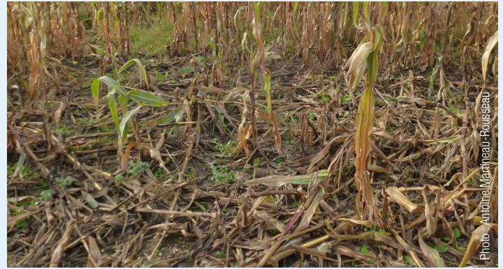
Domages causés par les sangliers dans un champ de maïs.