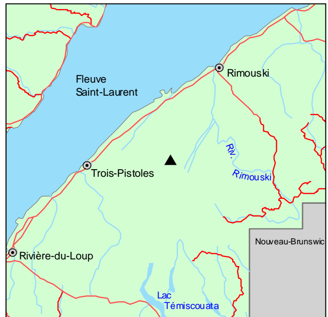
▲ Forêt ancienne de la Rivière-Cossette

Le couvert forestier de la forêt est largement dominé par l'érable à sucre, auquel se joignent le sapin baumier, le bouleau jaune et quelques épinettes blanches. La régénération en sous-étage est aussi très largement occupée par l'érable à sucre. On y trouve également l'érable de Pennsylvanie, le bouleau jaune et le sapin baumier. Le parterre forestier marque une certaine transition vers les forêts mélangées des collines appalachiennes. On y observe notamment plusieurs espèces acidophiles typiques des sapinières, par exemple, Oxalis montana , Huperzia lucidula et Maianthemum canadense .