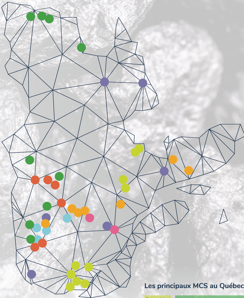
Les principaux MCS au Québec : projets et mines