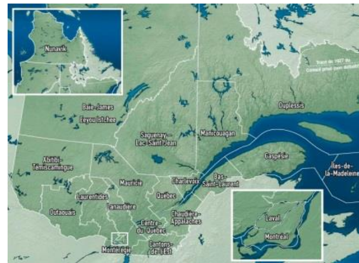
Quelle(s) région(s) touristique(s) avez-vous l'intention de visiter lors de ce séjour au Québec ? TOP 5 SELON LES MARCHÉS

Les résultats détaillés sont présentés dans les pages suivantes.