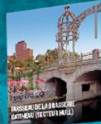
TRASSERIE DE LA BASSERIE GATIŒAU (SECTEUR HAUL)