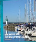
MARINA-BUTLER GATIŒAU (SECTEUR HAUL)

Savez-vous comment les Outaouais ont pu devenir ce que nous sommes aujourd'hui ? Avec la construction de la Derive des Étoiles, le pont de bois de Saint-Léon, le pont couvert de Wakefield et le pont de la basse-rie de Gatineau, les Outaouais ont pu développer leur tourisme nautique. Avec ces ponts, les Outaouais ont pu développer leur tourisme nautique. Avec ces ponts, les Outaouais ont pu développer leur tourisme nautique. Avec ces ponts, les Outaouais ont pu développer leur tourisme nautique. Avec ces ponts, les Outaouais ont pu développer leur tourisme nautique. Avec ces ponts, les Outaouais ont pu développer leur tourisme nautique. Avec ces ponts, les Outaouais ont pu développer leur tourisme nautique.