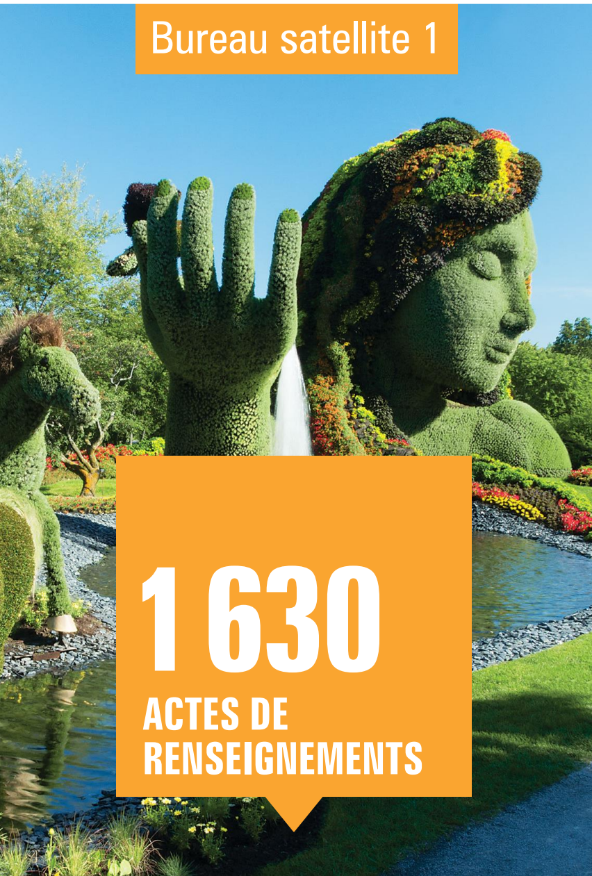
Bureau satellite 1