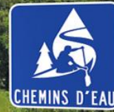
LIEN HISTORIQUE NATIONAL DU MANOIR-PAPINEAU (MONTEBELLO)